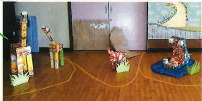
アニマルハット・どうぶつわなげは牛乳パックで制作しました。