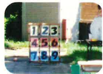
【ストラックアウト】

しかし、もちろん全てがコロナ以前と同様というわけにはいきません。コロナはまだ完全に終息したわけではなく、インフルエンザやその他の感染症の心配もあります。コロナ対策で培った感染症への予防のスキルを活かして、施設内の換気や消毒を行い、これからも利用される皆さまが安心して楽しく遊べる児童館にしていきたいと思えます。