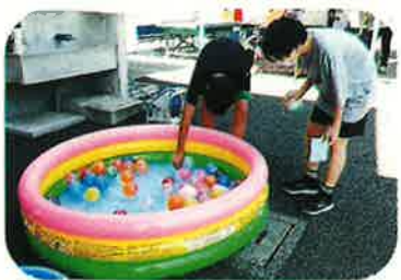
【ヨーヨー風船つり】