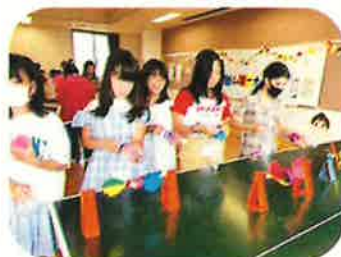
【ペットボトル空気砲での的当て】