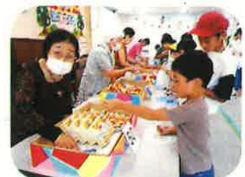
【お菓子交換コーナー】