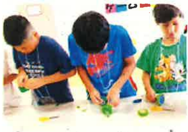
【ペットボトル空気砲作り】

今年の夏は、江南市内3児童館(交通児童遊園、古知野児童館、藤ヶ丘児童館)でそれぞれ夏まつりを開催しました。どの児童館もたくさんの親子の参加があり、それぞれのコーナーを楽しみました。